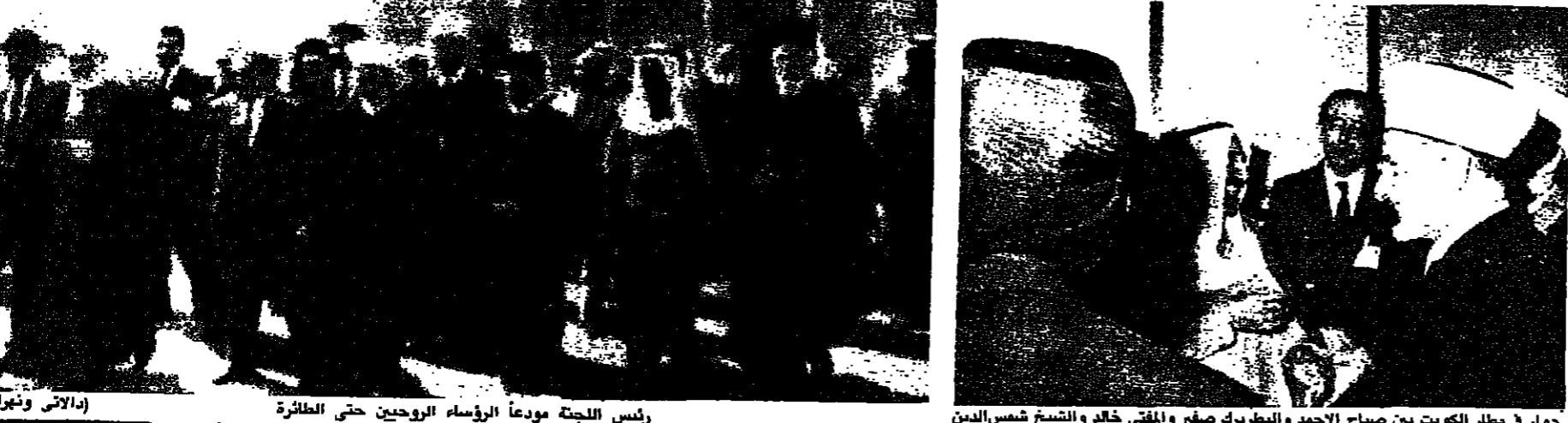
رئيس اللجنة مودعاً الرؤساء الروحيين حتى الطائرة